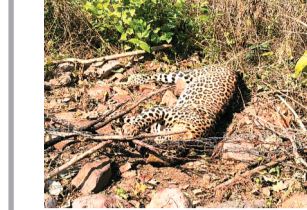
हरिभूमि न्यूज़ | अशोकनगर

पिछली 17 फरवरी को वनपक्षेत्र चंदेरी में पाए गए क्लच वायर से बने फंसे से 01 तेंदुआ मृत अवस्था में पाया गया था। वन अंमले द्वारा प्रकरण कायम कर जांच में लिया गया। अपराधियों को पकड़ने हेतु वनमंडल स्तरीय टीम गठित की गई। गठित टीम द्वारा स्थानीय मुखबिर तंत्र विकसित कर संकलित किये गए तथ्यों के आधार पर दिनांक 22-02-2026 को तहसील चंदेरी के ग्राम बेहटी से करन