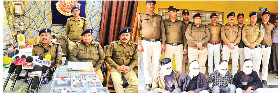
आरोपियों के पास से चुराए गए जेवर शत प्रतिशत बरामद